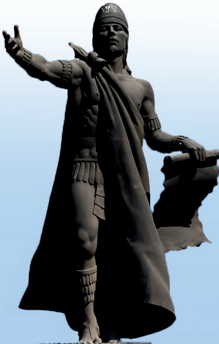
NEZAHUALCOYOTL REY DE TEXCOCO 1402 - 1472